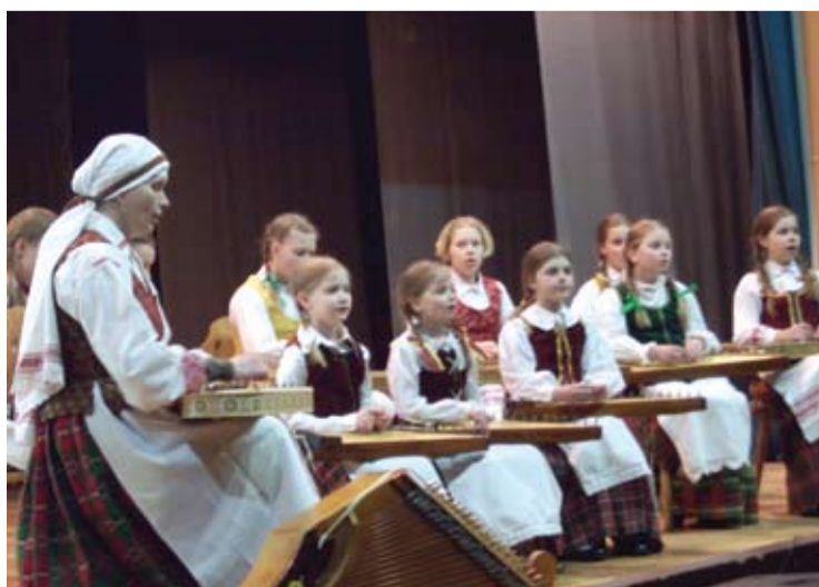
„Pasagėlės“ kanklininkų melodijos ir dainos skambėjo Svėdasų kultūros rūmų scenoje.

SPAUDOS, RADIJO IR TELEVIZIJOS RĖMIMO FONDAS