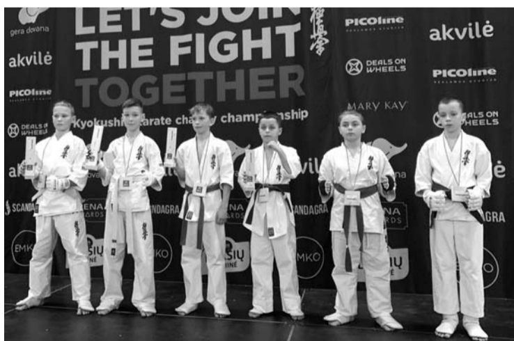
Jauniesiems Anykščių sportininkams varžybos Kaune buvo sėkmingos.