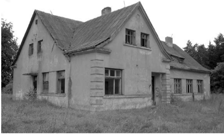
Buvusios Užunvėžių mokyklos pastatas nenaudojamas ir apleistas stovi jau 20 metų.

Pasvalyje registruota viešoji įstaiga „Socialinė kryptis“ turi planą iš Anykščių rajono savivaldybės išsinuomoti buvusios mokyklos pastatą Kurklių seniūnijos Užunvėžių kaime. Savivaldybei būsimieji pastato nuomininkai šį 20 metų nenaudojamą, apleistą, prastos būklės pastatą žada renovuoti.